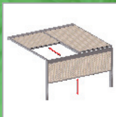
BASIS + windvaste, afsluitbare voorzijde