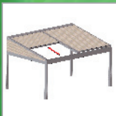
BASIS + gesloten driehoekoplossing