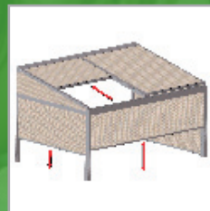
BASIS + windvaste, afsluitbare voorzijde en zijkanten

Door het gebruik van de RENSON® Fixscreen®-technologie, in combinatie met de realisatie van een optimale doekspanning , kan het neerslagwater dat op het doek terecht komt, via verborgen geleidingskanalen afgevoerd worden. Door deze geïntegreerde waterafvoer kan zelfs wanneer het doek van de zonwering niet volledig uitgerold is, toch alle neerslagwater die op het doek terecht komt, afgevoerd worden.