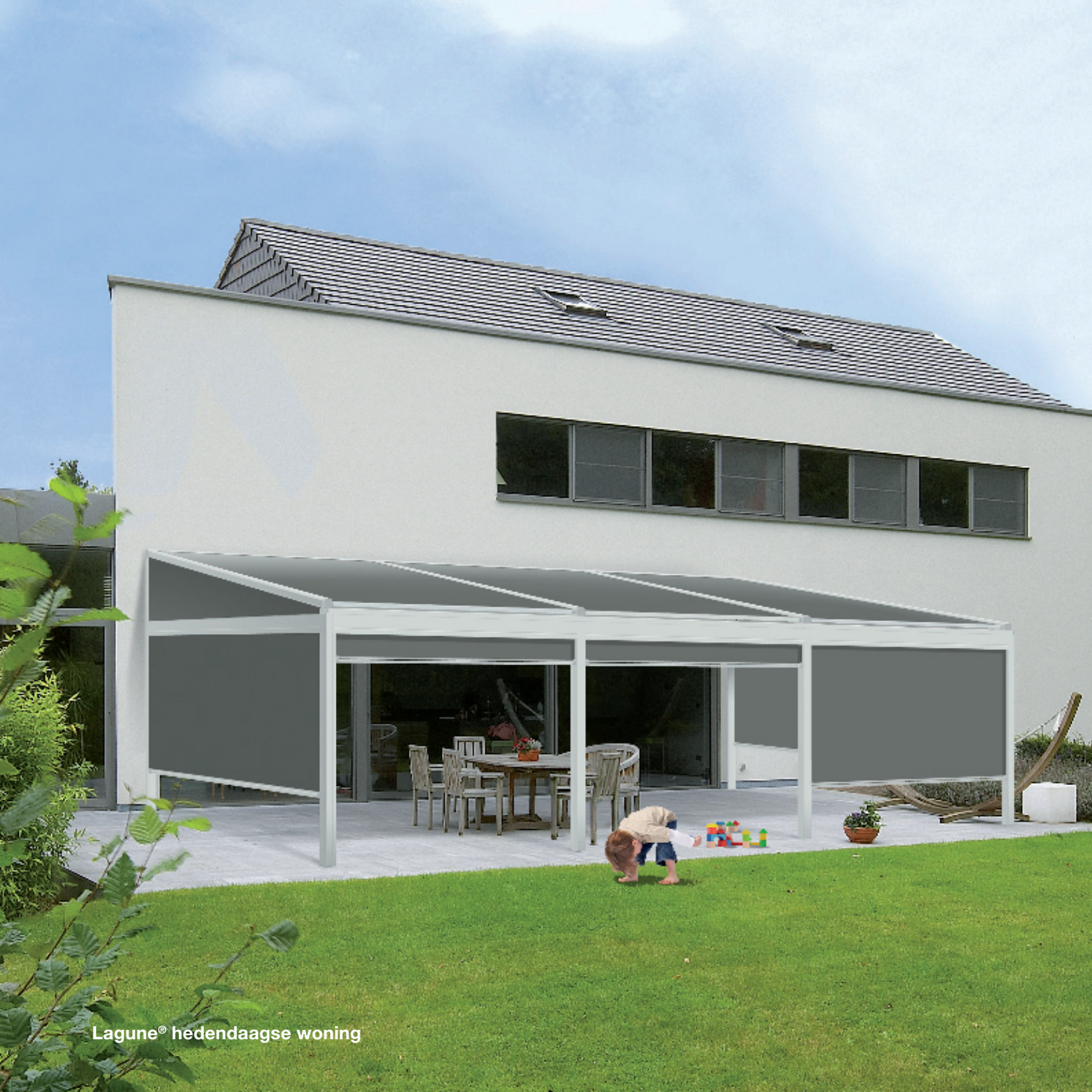
Lagune® hedendaagse woning