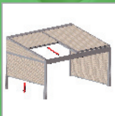
BASIS + windvaste, afsluitbare zijkanten